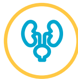
Kanker urologi (prostat, kandung kemih, ginjal, testis)