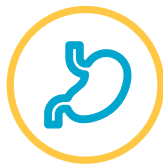
Kanker saluran pencernaan (kerongkongan, lambung, kolorektal, pankreas, hati dan kantong empedu)