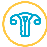
Kanker ginekologi (serviks dan rahim)